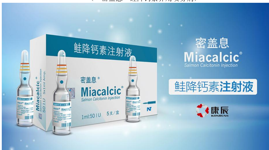
（“密盖息”鲑降钙素注射液）

“密盖息”是瑞士诺华原研的鲑降钙素，为多肽类药物，有注射剂和鼻喷剂两种剂型，分别在德国、法国生产。具有调节钙代谢、抑制破骨细胞活性的作用，适应症包括：原发性骨质疏松症、继发性骨质疏松、骨量减少或骨质溶解引发的疼痛、预防制动导致的急性骨丢失、高钙血症和高钙血症危象、Paget氏骨病、神经营养障碍-Sudeck氏病等。