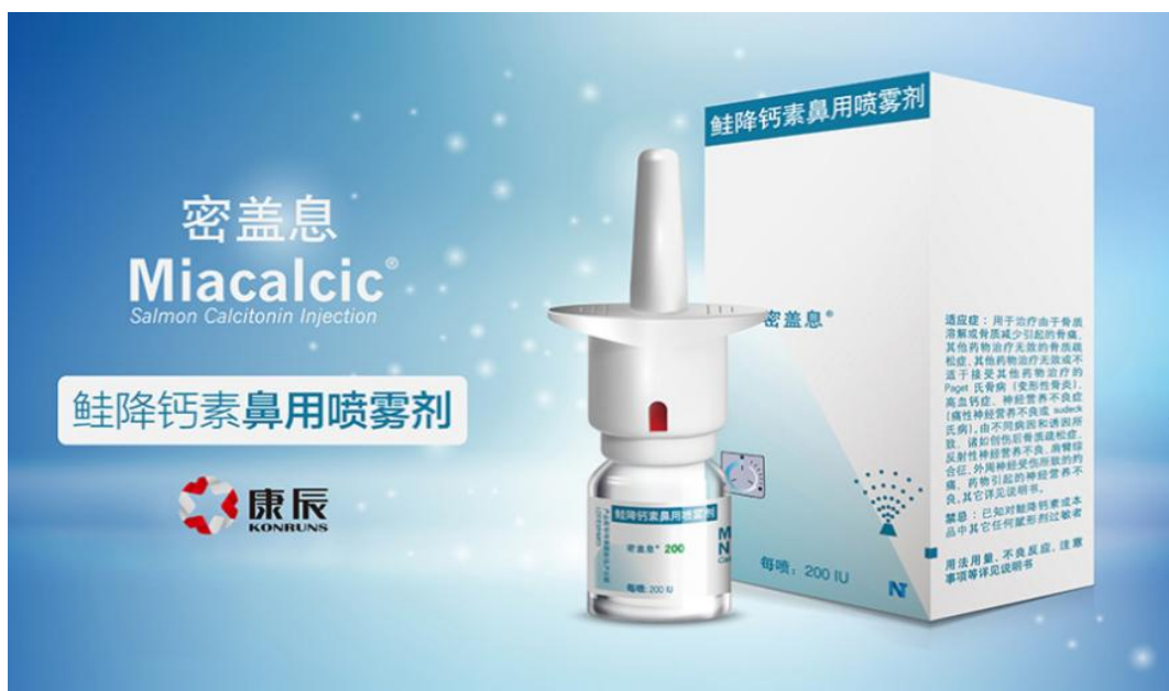
（“密盖息”鲑降钙素鼻用喷雾剂）